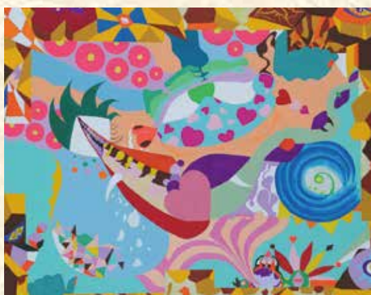
SKE48 北川愛乃(アイドル)「命の起源」