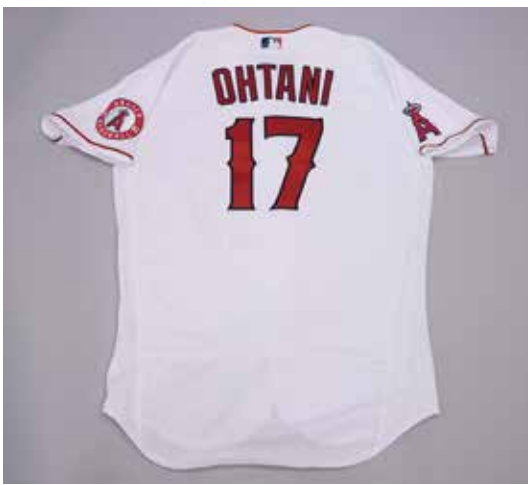
【25周年特別スペシャルテーマ出展】「日本の底力」大谷翔平のスペシャルアイテムの展示 本邦初公開